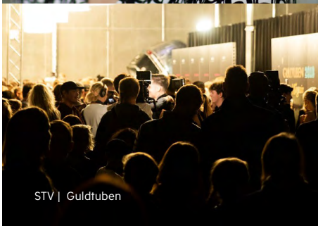
STV | Guldubben