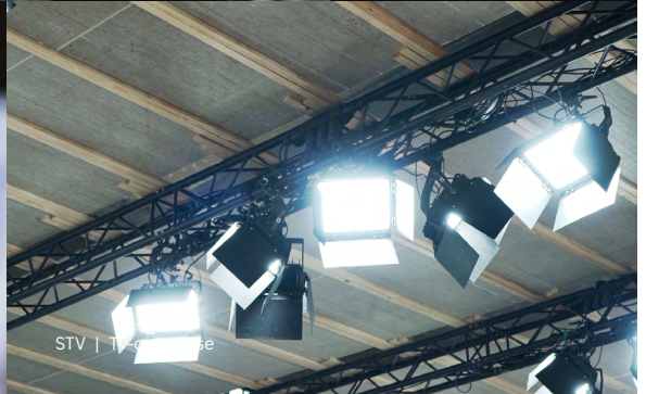
STV | Tjeneste