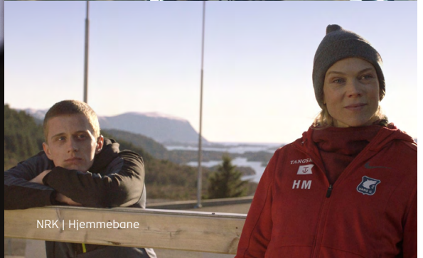
NRK | Hjemmebane