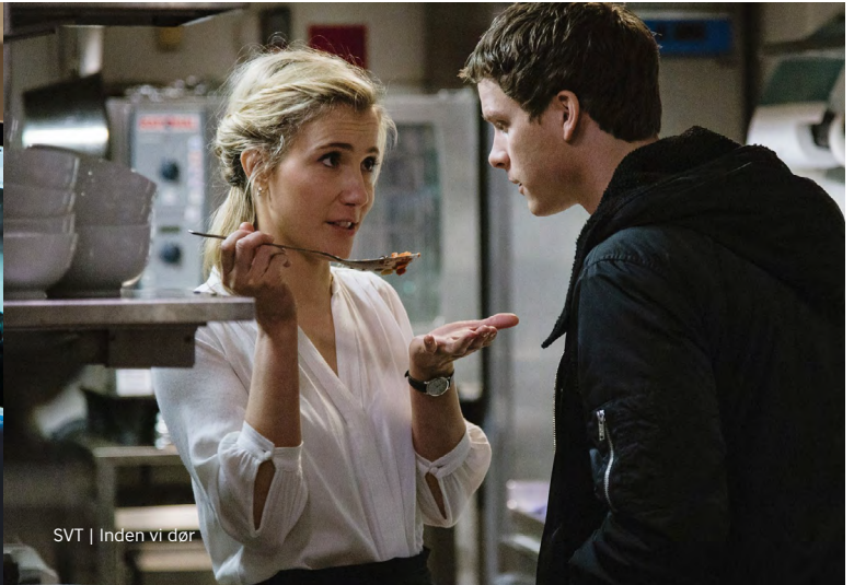
SVT | Inden vi dør