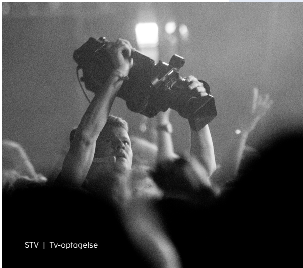
STV | Tv-optagelse

Den nye brug af tv-indhold krævede en aftale med hver enkel rettighedshaver, og det kunne hurtigt blive besværligt. Derfor blev der udviklet en model, som gjorde det lettere at bruge og administrere rettighederne. Det er kort fortalt baggrunden for, at Copydan blev etableret. I dag består Copydan af 6 foreninger med hvert deres særlige fokus inden for rettighedsområdet. En af disse foreninger er Copydan Verdens TV.