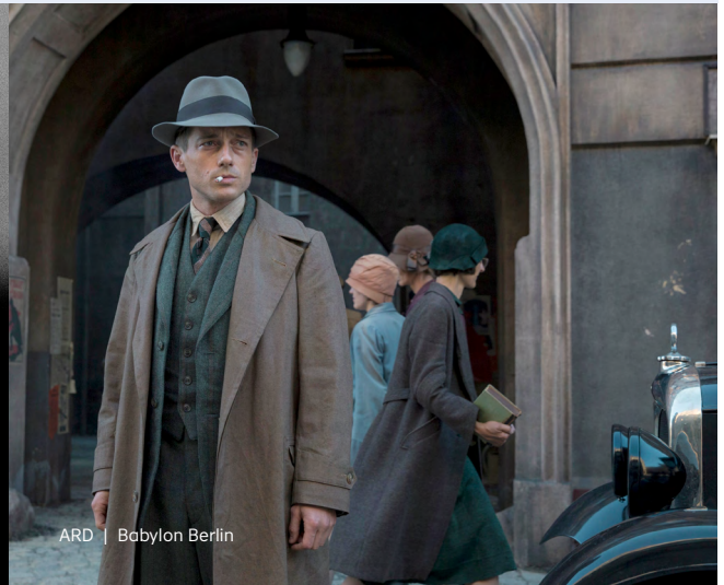
ARD | Babylon Berlin